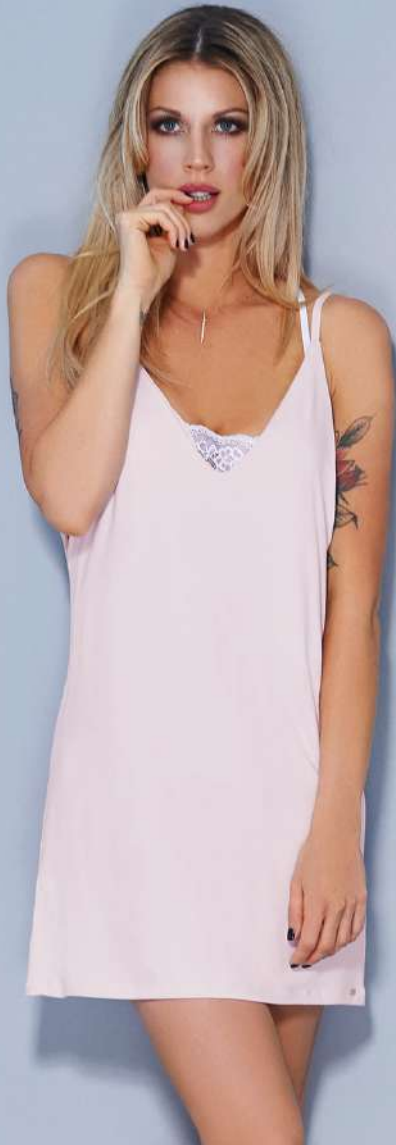
7090 • Camisolín de modal. T: 1 y 2. C: Azul, Blanco, Negro, Rosa Vintage, Verde Militar.