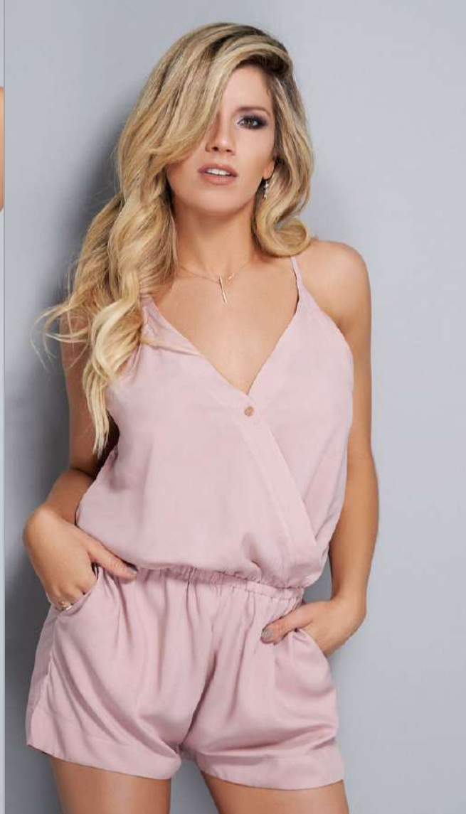
8108 • Mono de tela plana con elástico en cintura y espalda. T: 1 al 3. C: Negro, Rosa Vintage.