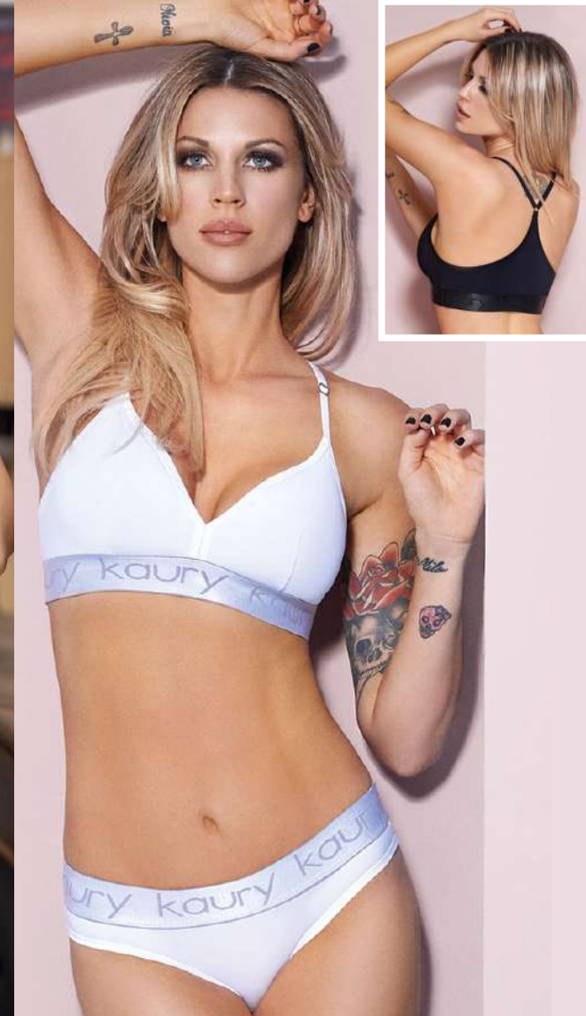
8100 • Conjunto de microfibra y elástico, con corpiño triangulito y colaless. T: 90 al 100. C: Blanco, Negro, Rosa Vintage, Azul Noche.