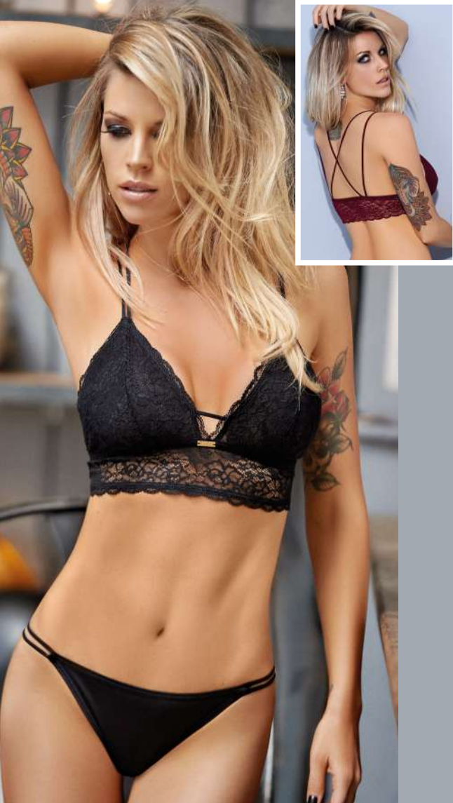
8070 • Conjunto de puntilla, tul y microfibra, con corpiño top triangulito con detalle en espalda y colaless. T: 90 al 100. C: Blanco, Bordo, Negro, Verde Militar.